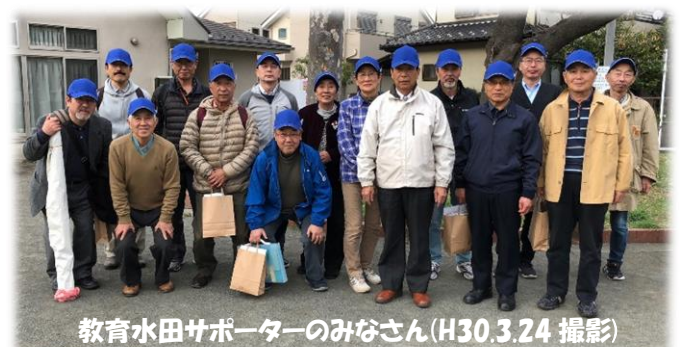
教育水田サポーターのみなさん(H30.3.24 撮影)