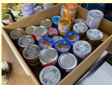
↑どの地区も 住民のみなさまから ご寄付がたくさん！